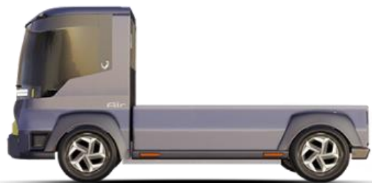
Châssis court L 3,90m