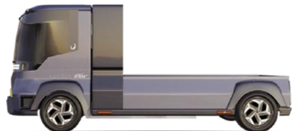
Châssis long 4,90m